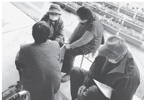
安来第1・第2支部 青空健康チェック 記録用紙を見ながら「あれからどうかいね?」