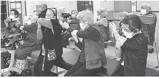
パワーリハビリの前に準備体操

虹には、パワーリハビリ機器があります。なないろ住宅の入居者さんから、健康維持のためパワーリハビリをやってみたいというお声を頂いたことをきっかけに有効利用できないか検討しました。