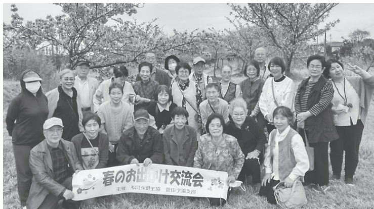
菅田学園支部 お出かけ交流会 八束町 千本桜にて 花も団子も…😊