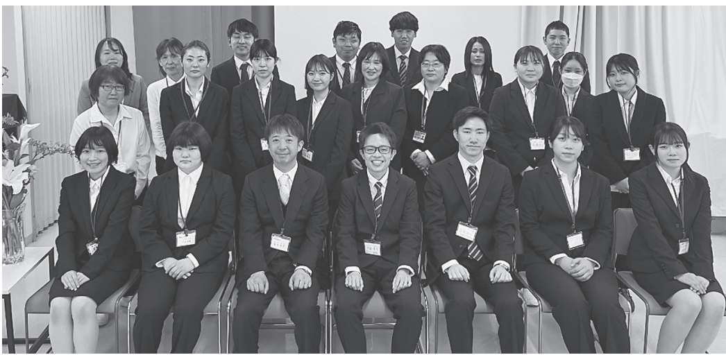
私たち新入職員、同期の仲間で頑張ります！