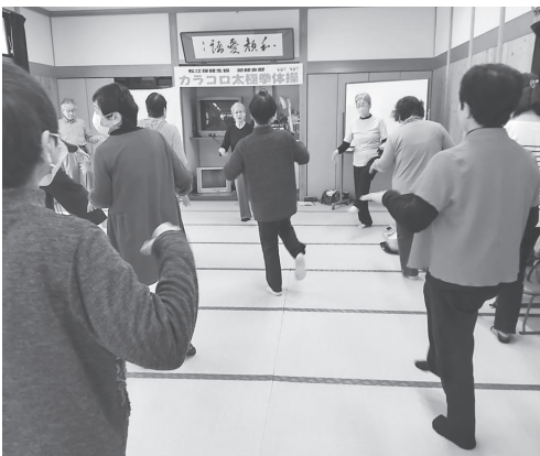
忌部支部 カラコト太極拳体操 みんなで体操 からだどころもゆったりと