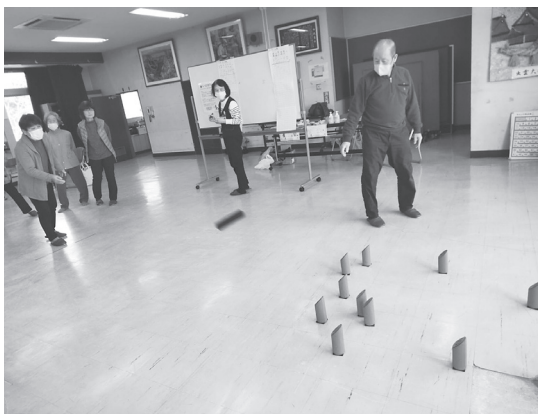
八幡大門支部 モルック交流会 からだもあたまも使うモルック 楽しいですよ!