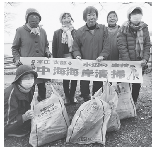
“SDGs”本庄支部 中海海岸清掃