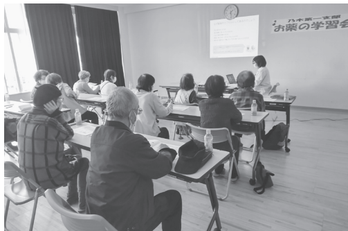
今飲んでいる薬についてたくさんの質問がありました!