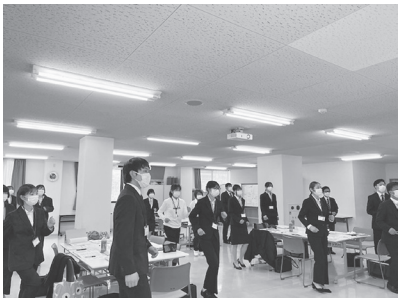
身体を動かして生協活動を「たいかん」(体感/体幹)