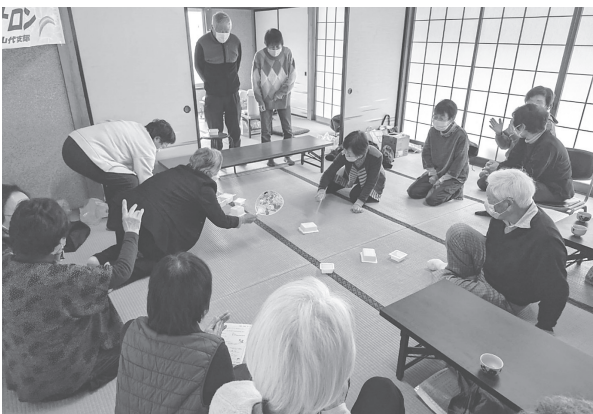
山代支部 かなびサロン開設しました! 豆腐のパック飛ばしあいゲームで大盛り上がり!

過ぎやすい季節になりました。 1月から3月のおでかけ企画や 交流会などの地域活動で 85名の組合員と 10名の運営委員が誕生しました。 たくさんの人とのつながりが広がりました。 これからもゆるやかに楽しく すすめていきます。