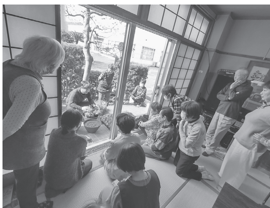
本庄支部 水辺のサロン開設しました! 寄せ植えをしました。 地域の憩いの場になっていくといいですね!