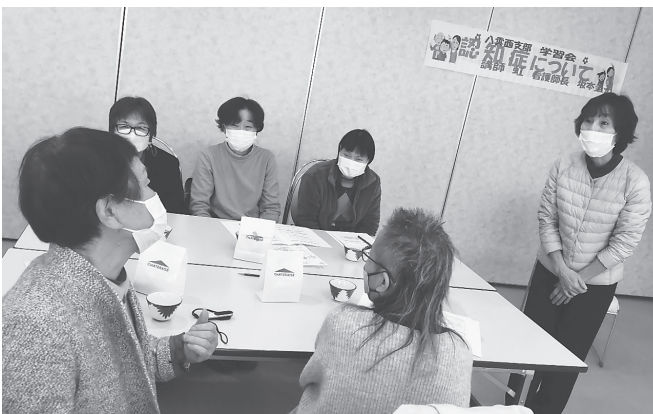
八雲西支部 認知症について 楽しく認知症の学習ができました