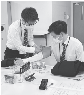
血圧測定は健康づくりの第一歩