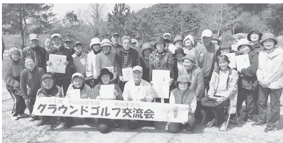
和気あいあいの交流会でした!