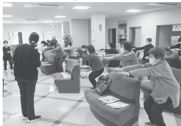
健診センター 組合員感謝企画 健康講座 2月~3月 計4回 53名の参加。 次回もぜひ企画をして欲しいとたくさんの声がありました♪