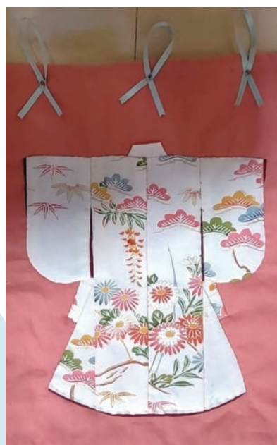
玉湯のおばちゃんさん 「着物のタペストリー」