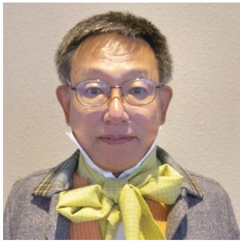
支部の活動のほかに松江市民合唱団の活動もしています。みなさん、一緒に歌いませんか?(昨年ニューイヤーオペラに出演した時の写真です。)