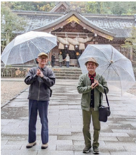
今年も元気に子どもの見守り活動や畑にがんばっていきたいです。