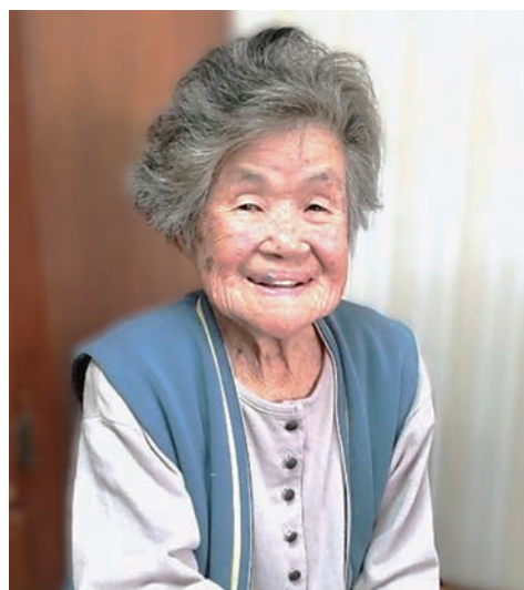
仲良し3人で毎月班会をしています。皆さん元気でおしゃべりがつきません。