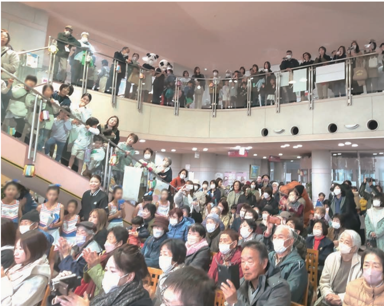
松江保健生協 笑顔まつり(11/30)