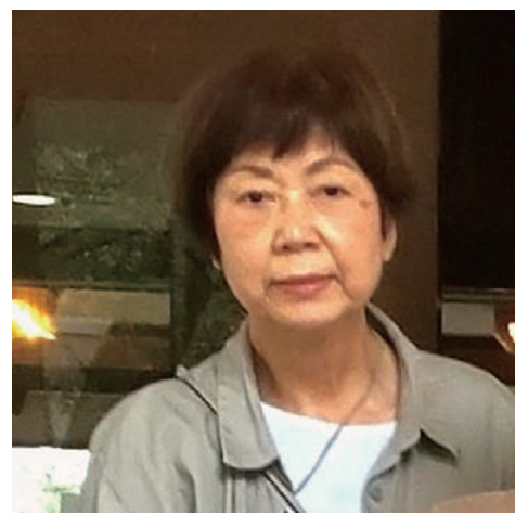
奥出雲支部は今年も元気な活動を行っていきたいと思っています。是非地域の健康づくりの輪に皆さんご参加下さい。