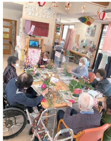
きれいなお花で明るくなるわあ

新年明けましておめでとうございます。 学園福祉センターは、今年3月で20年目を迎えます。昨年は、センター建物南側壁上部貼り替え、IT環境整備等ハード面の修繕や BCP(業務継続計画)等のセンター全体職員合同研修会を開催し交流を深め、秋には多くの組合員さんにご協力を頂き秋祭りも盛大に行うことが出来ました。 コロナ5類となつて以降、ボランティア受け入れや外出行事・集団レクリエーションも再開し、活気が戻ってきています。経営面では、人材不足や利