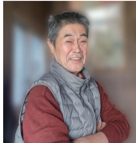
本年もよろしくお願いします。今年も元気に楽しく健康づくりの輪を広げていきましょう。